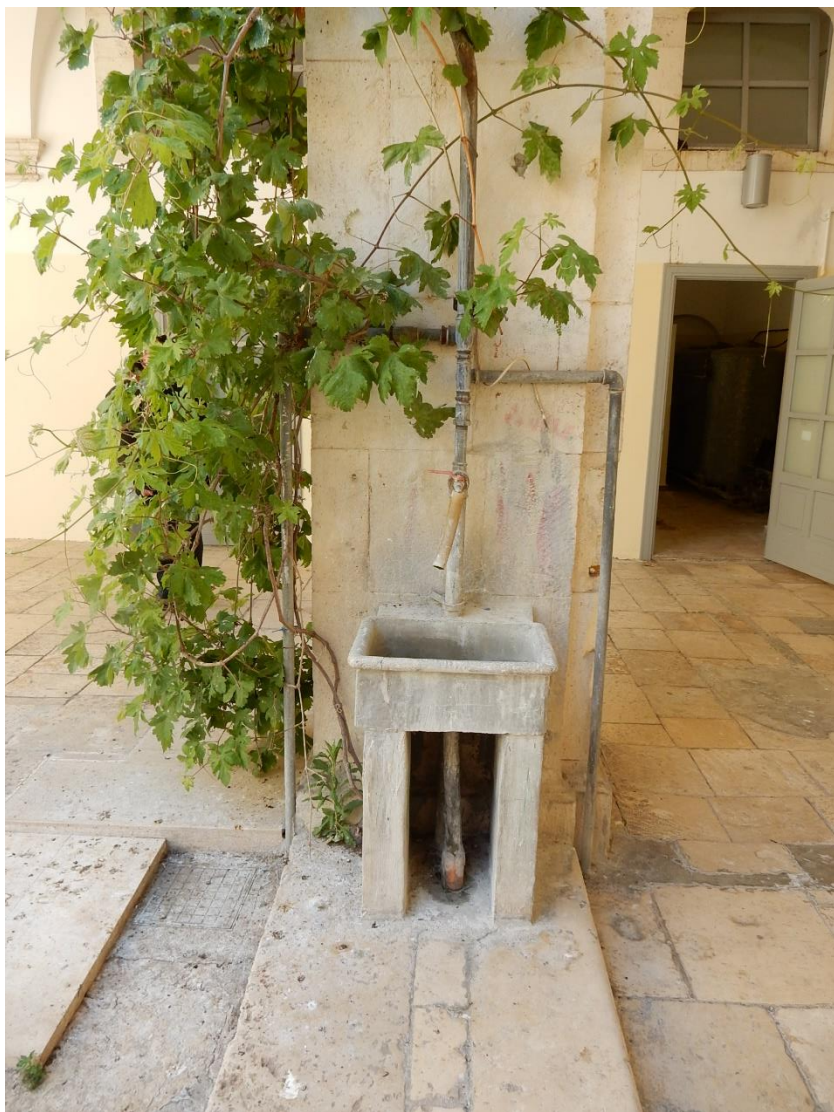
Foto 9: fontanella corte (prevista eliminazione tubazioni a vista in acciaio)